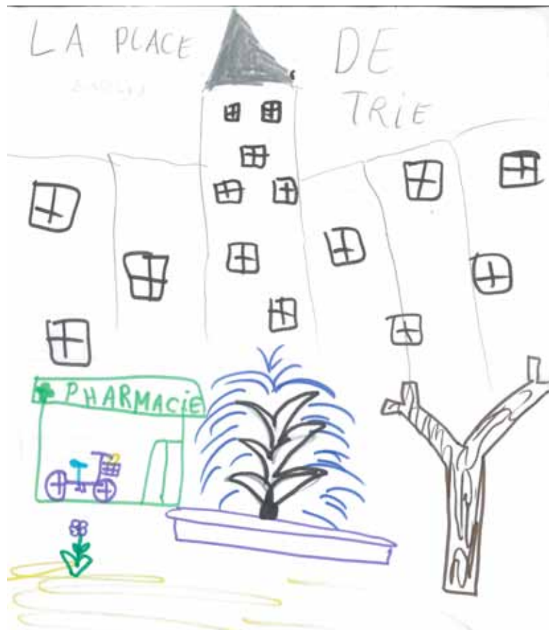
Dessin de la place de Trie par notre équipe de graphistes

A l'école il y a plein d'enfants, des grands et des petits. Il y a 165 enfants dans l'école. Nous avons un directeur et voilà son interview.